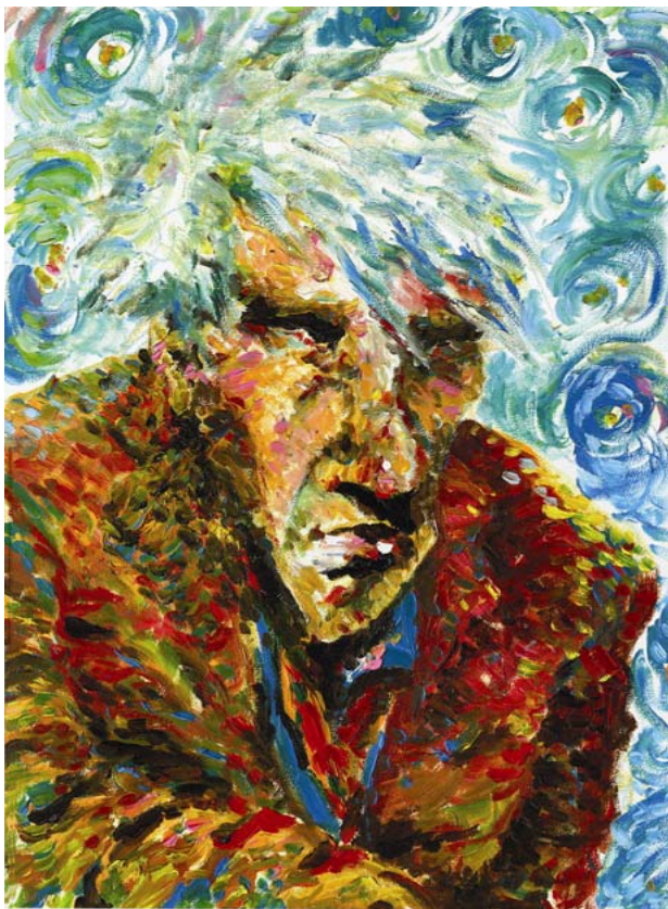
“Ritratto olandese” olio su tela