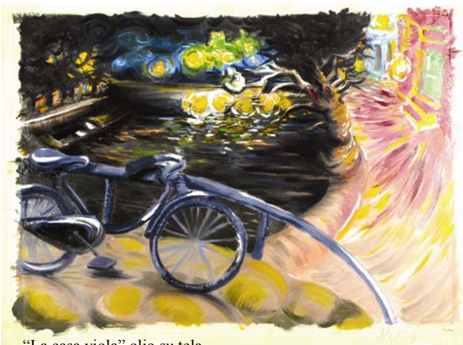
“La casa viola” olio su tela